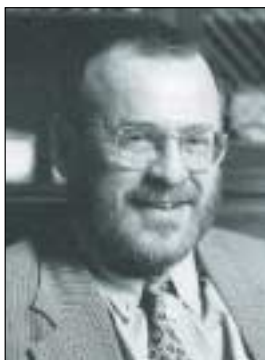
Jón Sigurðsson formaður