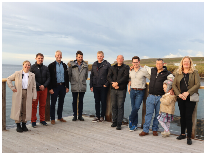
Verkefnisstjórn Betri Bakkafjarðar 2022

Verkefnisstjórn mótar starfslýsingu fyrir verkefnisstjóra þar sem það á við og ræður í starfið. Verkefnisstjóri starfar í umboði verkefnisstjórnar. Formaður verkefnisstjórnar og verkefnisstjóri í samstarfi við verkefnisstjórn, eru talsmenn verkefnisins út á við. Verkefnisstjórn mótar stefnu varðandi kynningu á verkefninu fyrir viðkomandi byggðarlag.