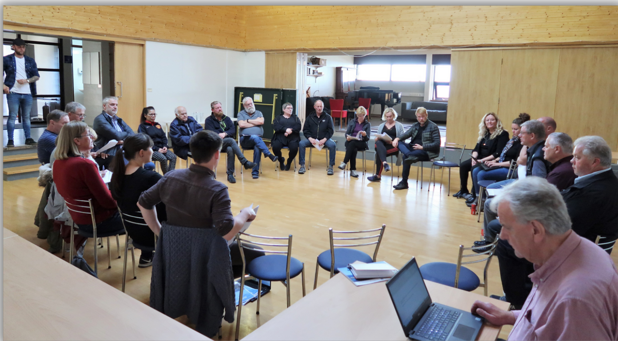
Frá íbúafundi 2021

Einhverjir hafa áhuga á að komið verði upp aðstöðu til matvælavinnslu. Önnur málefni sem komu til umræðu var hugmynd um sumarþúðir fyrir börn á Bakkafirði, tækifæri tengd raungreinakennslu, bæði fyrir nemendur á staðnum og mögulega víðar að, sem og fræðasetur. Þar sem hver og einn íbúi skiptir svo miklu máli, var varpað fram hugmynd um að greina áhugas-við og hæfni íbúa, menntun og reynslu og sníða verkefni til eflingar byggðar að óskum, löngunum og krafti samfélagsins.