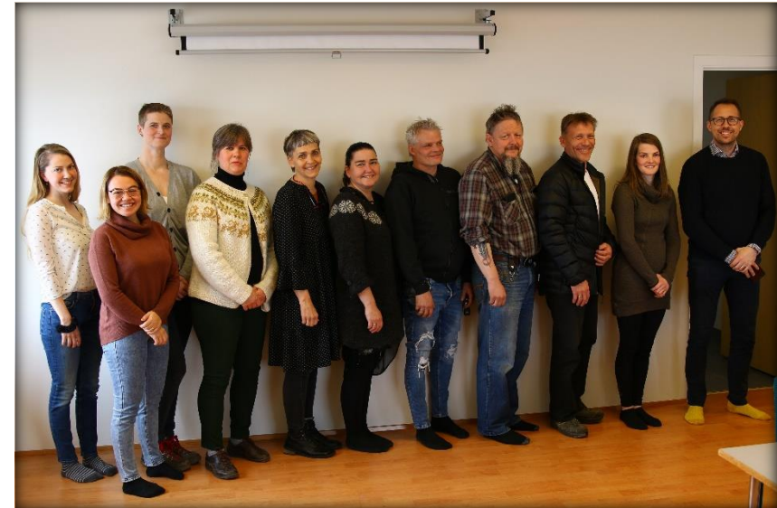
Styrkþegar(eða fulltrúar) árið 2020.

** Vert er að taka fram að eitt af þeim verkefnum sem hlaut styrk úr Öndvegissjóði í sérstöku fjárfestingarátaki rískisins vegna Covid-19 var Kjöttvinnslan í Árdal.