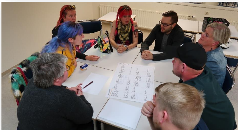
Mynd 2 - 4: Íbúafundir