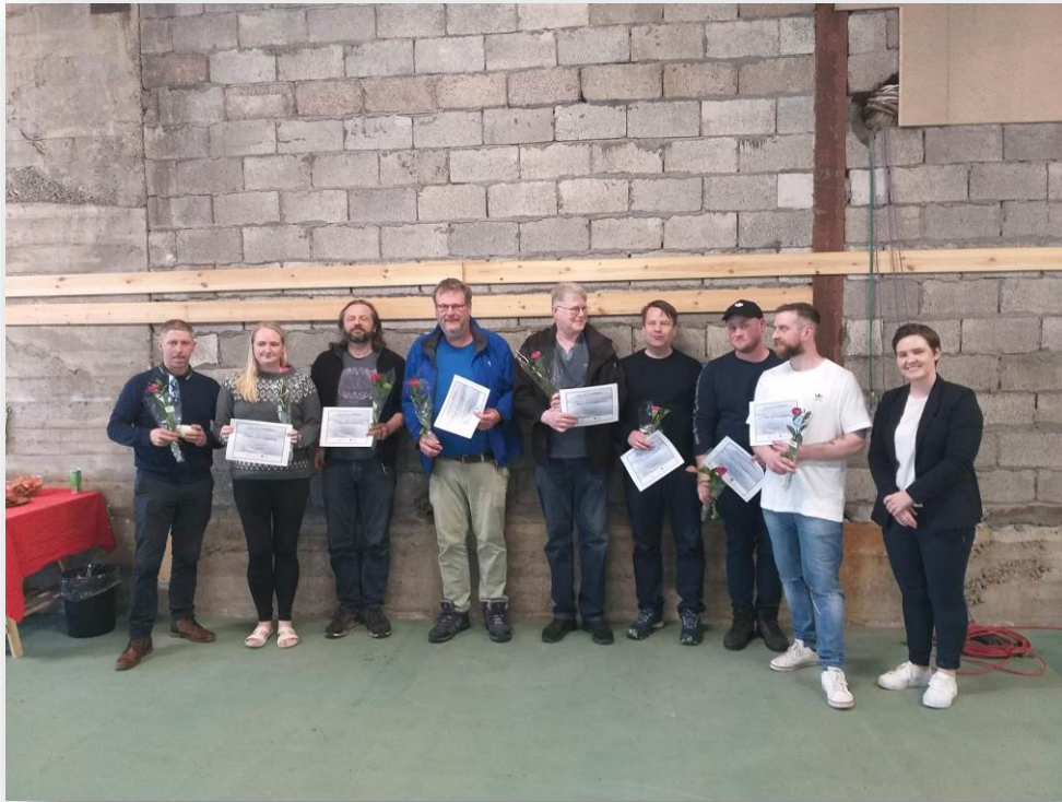
Mynd 7: Úthlutunarathöfn 2023