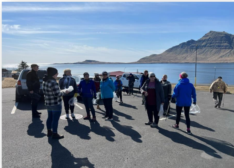
Mynd 1 Hreinsunardagur 30.apríl 2023