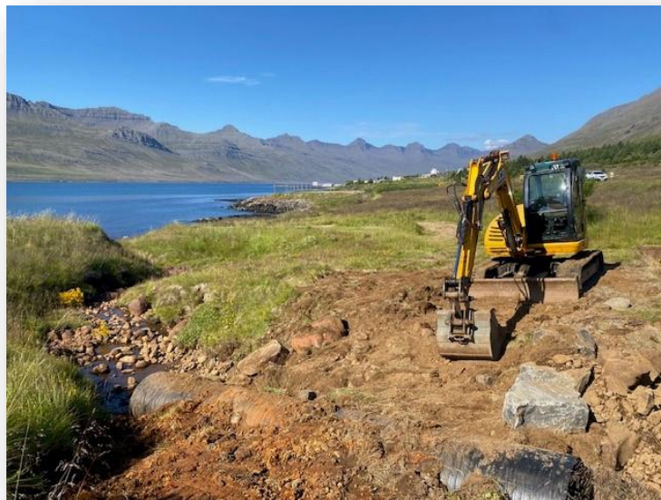
Mynd 5: Göngustígagerð norðan við Stöðvarfjörð

1.12 Kannaðir verði möguleikar á aðgerðum í orkusparnaði fyrir íbúðarhúsnæði fyrir lok árs 2023: Í lok nóvember var sendur tölvupóstur til íbúa Stöðvarfjarðar og þeim kynntur styrkur Orkustofnunar til kaupa og uppsetningar á varmadælum á köldum svæðum. Áhugi er mikill á meðal húseiganda og byrjað er að kanna hvort hægt sé að fá tilboð hjá fyrirtækjum sem sérhæfa sig í uppsetningu á varmadælum í innkaupum og vinnu við uppsetningu.