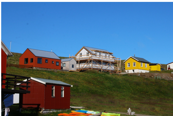
Litadýrð á Djúpvík í Árneshreppi

Hartnær tíu ár eru síðan verkefnið Brothættar byggðir hóf göngu sína. Í upphafi verkefnisins var hugmyndin sú að búa til aðferð eða verklag sem hægt væri að yfirfæra á byggðarlög sem stæðu frammi fyrir sambærilegum vanda, þ.e. viðvarandi fækkun íbúa og erfiðleikum í atvinnulífi. Raufarhöfn var fyrsta byggðarlagið sem tók þátt í verkefninu Brothættum byggðum. Verkefnið Raufarhöfn og framtíðin hófst árið 2012 og því lauk árið 2018. Segja má að verklag, framkvæmd og framvinda Brothættra byggða hafi mótast og þróast í fyrstu með þátttöku fyrsta byggðarlagsins, Raufarhafnar, ásamt þátttöku þeirra þriggja sem á eftir fylgdu. Það voru Bíldudalur, Breiðdalur og Skaftárhreppur. Reynslan og árangurinn af þeim verkefnum varð leiðarljósið í þeim byggðarlögum sem síðar hafa tekið þátt í verkefninu. Á árunum 2015-2016 kynntu fulltrúar Byggðastofnunar og aðrir hagaðilar sér sambærileg byggðapróunarverkefni í öðrum löndum, einkum í Noregi og í Skotlandi. Samgöngu- og sveitarstjórnarráðuneytið hefur einu sinni framkvæmt úttekt á verkefninu Brothættar byggðir, var það árið 2014 – 2015 og sá EY Ísland um úttektina fyrir þeirra hönd sjá hér . Á döfinni er að framkvæma mat á verkefninu Brothættar byggðir nú þegar verkefnið hefur staðið yfir í um áratug.