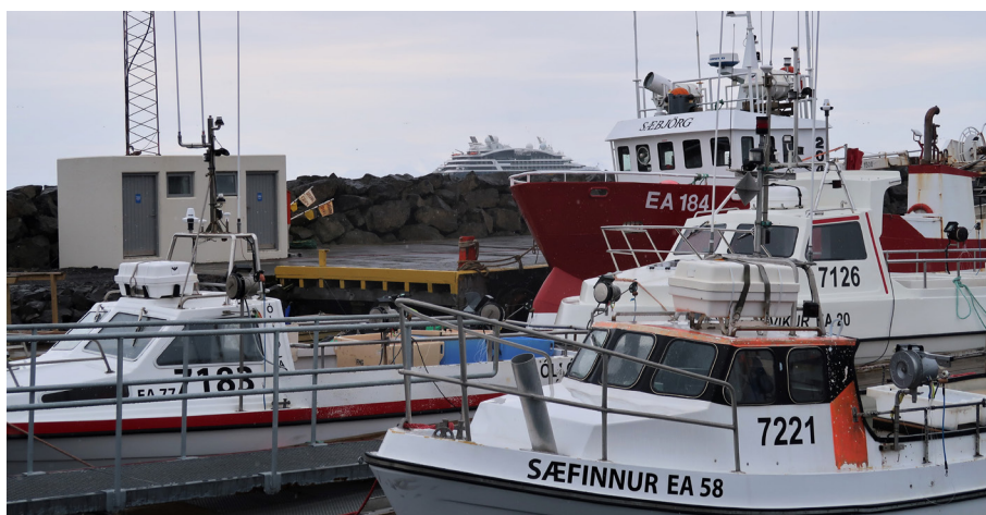
Úr Grímseyjarhöfn - farþegaskip lónar utan hafnarinnar

Sjávarútvegur er nauðsynleg forsenda byggðar í eyjunni, og í því samhengi þarf hið opinbera að finna leiðir til að auðvelda nýliðun. Til staðar eru tækifæri til að skapa meiri verðmæti úr sjávarfangi og fjölga þannig störfum, en nú fer fiskurinn beint á markað. Einnig hefur verið rætt um mögulega framleiðslu á öðrum afurðum úr matarkistu Grímseyjar. Ferðaþjónusta er önnur mikilvægasta atvinnugreinin í eyjunni og tækifæri til vaxtar eru mikil. Nauðsynlegt er þó að byggja upp innviði hennar s.s. með því að bæta samgöngur, þ.e. að fá nýja ferju og fjölga flugferðum yfir sumartímann (yfirvetrartímann erflogið 3x í viku en yfir sumartímann 2x í viku). Þá eru forsendur fyrir fjölgun gistirýma fyrir ferðamenn og uppbyggingu á aukinni afþreyingu. Þá vantar sárlega gístaðstöðu fyrir starfsfólk í ferðaþjónustu. Verkefnisstjóri telur afar mikilvægt að Grímsey njóti handleiðslu næstu árin við uppbyggingu atvinnulífs og samfélags, sem og að koma hagsmunamálum á framfæri til viðeigandi aðila.