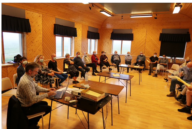
Íbúafundur í Árneshreppi