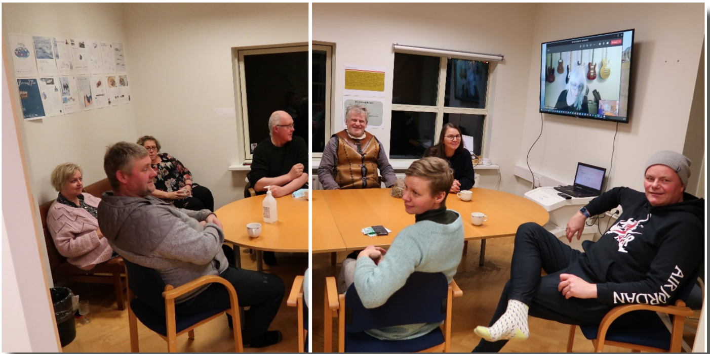
Rýnihópsviðtal á Þingeyri - fulltrúar styrktra verkefna