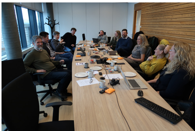
Verkefnisstjórar fundar í nýju húsnæði Byggðastofnunar