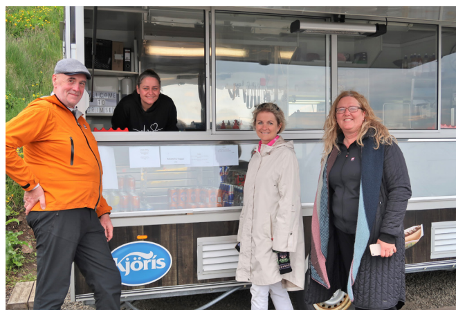
Hluti verkefnisstjórnar fær sér pylsu í Grimsey

Fullyrða má að styrkirnir hafi haft hvetjandi áhrif í samfélögunum. Mörg verkefni hafa ýmist sótt í sig veðrið, eða jafnvel hafist í kjölfar styrkumsóknar. Yfirlit yfir styrkt verkefni má sjá í umfjöllun í köflum um einstök byggðarlög.