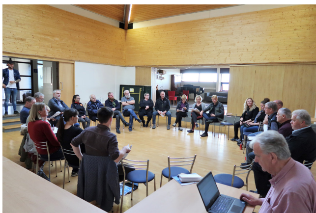
Íbúafundur á Bakkafirði