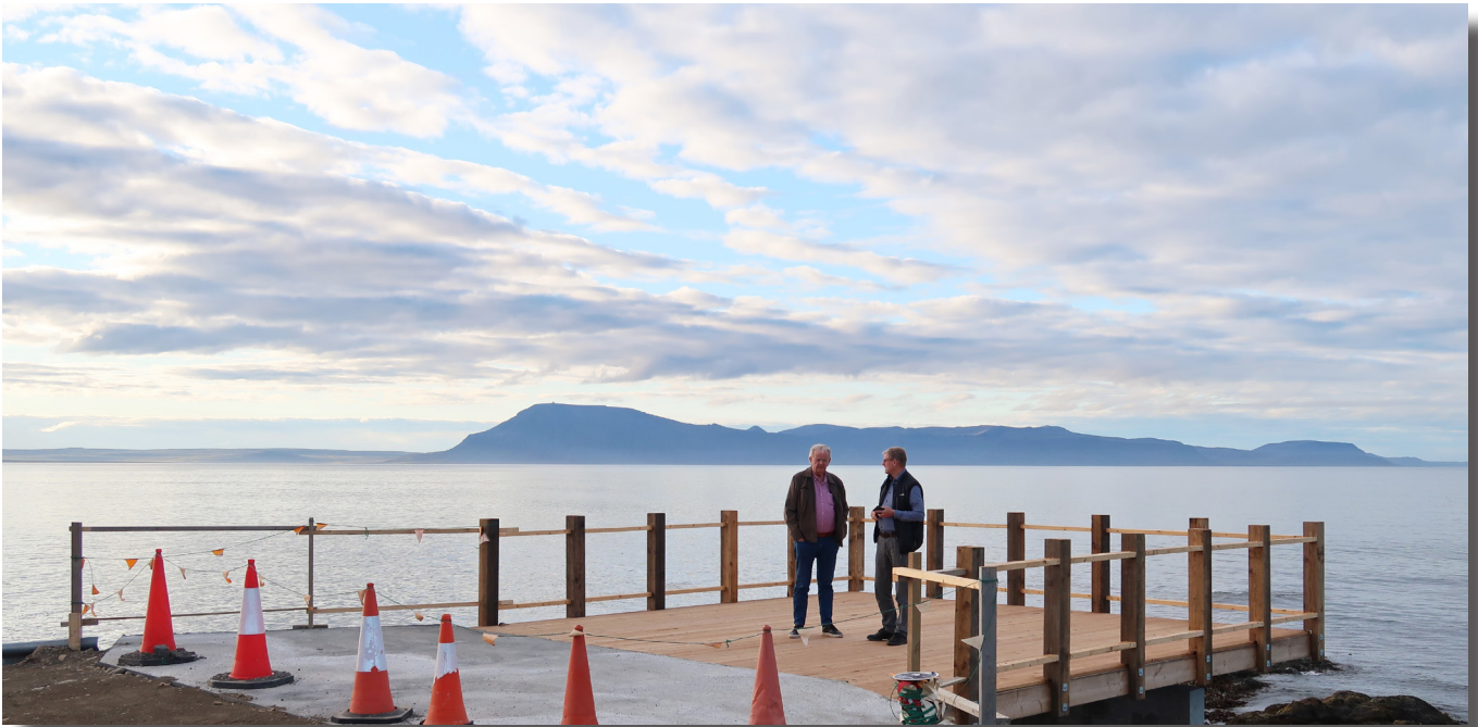
Nýr útsýnispallur á Hafnartanga á Bakkafirði