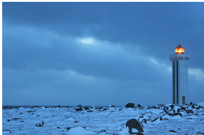
Kópaskersviti í skammdegisbirtu

Á árinu 2021 var Byggðastofnun aðili að sex verkefnum undir merkjum Brothættra byggða. Þau eru: