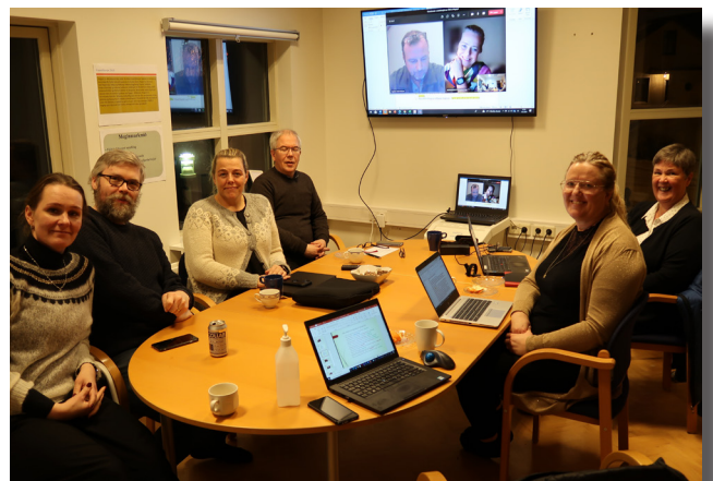
Fundur í verkefnisstjórn Allra vatna til Dýrafjarðar

Í henni eiga sæti fulltrúar Byggðastofnunar, viðkomandi sveitarfélags, landshlutasamtaka og atvinnu- þróunarfélags ásamt fulltrúum íbúa sem að jafnaði eru tveir. Dæmi eru þó um fleiri fulltrúa íbúa. Verkefnisstjórn fundar reglubundið ýmist með fjarfundasniði eða í þátttökubýggðarlagi. Eitt mikilvægasta hlutverk verkefnisstjórnar í hverju þátttökubýggðarlagi er að móta verkefnisáætlun og tryggja að henni sé fylgt, auk þess að móta stefnu varðandi kynningu á verkefninu fyrir viðkomandi byggðarlag.