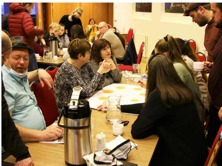
Íbúafundur í Fjarðarborg

Að auki er unnið áfram að verkefninu Samfélagsmiðstöðin Fjarðarborg sem hlaut 10.000.000 króna styrk úr Öndvegissjóði Brothættra byggða 2020.