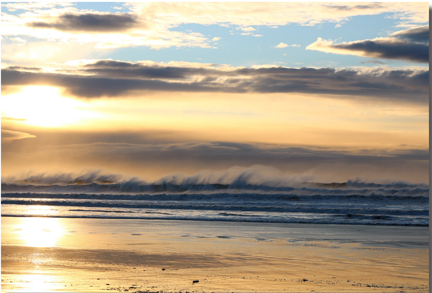
Brim í Núpasveit við Öxarfjörð

Enn fremur lauk verkefninu Öxarfjörður í sókn í Öxarfjarðarhéraði í lok ársins 2020. Þess ber þó að geta að vegna aðstæðna í þjóðfélaginu vegna COVID-19 síðustu tvö ár gafst ekki tækifæri til að halda loka íbúafund í byggðarlaginu þar sem til stóð að leggja mat á verkefnið og ígrunda áætlanir um verkefnið til framtíðar. Ráðgert er að slíkir fundur verði haldinn um leið og færi gefst á árinu 2022.