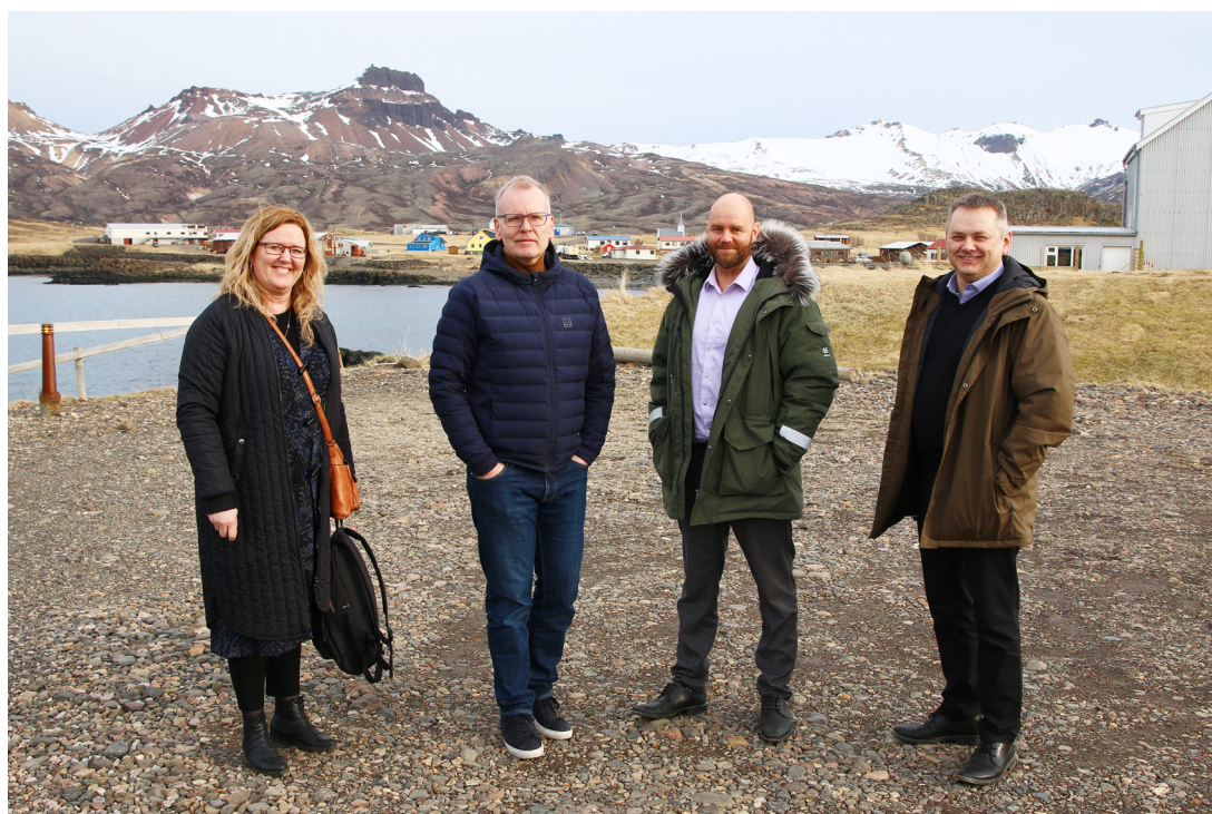
Fulltrúar Byggðastofnunar í heimsókn á Borgarfirði eystri

Svo sem sjá má á undirmerkiðunum er lykilatriði að fá fram skoðanir íbúanna sjálfra á framtíðarmöguleikum heimabyggðarinnar og leita lausna á þeirra forsendum í samvinnu við ríkisvaldið, landshlutasamtök, atvinnuþróunarfélög, sveitarfélagið, brottflutta íbúa og aðra hagaðila.