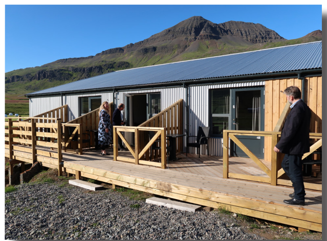
Gistiaðstaða Urðartinds í Norðurfirði