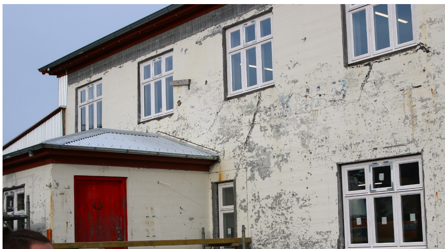
Gamla Kaupfélagið á Borgarfirði eystri tekur stakkaskiptum hjá Blábjörgum ehf

Verkefnið Betri Borgarfjörður hóf göngu sína síðla árs 2017 og vel sótt íbúaping var haldið í febrúar árið 2018. Þar voru helstu hugðarefni íbúa rædd og stefna verkefnisins grófllega mótuð. Þá voru einnig fulltrúar íbúa í verkefnisstjórn kosnir. Verkefnið var í lokaáfangi Brothættra byggða á árinu. Verkefnisáætlun má sjá hér .