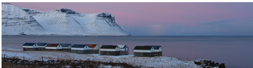
Dýrafjörður í desember

Íbúafundur var haldinn 7. júní eftir fjórar frestanir vegna samkomutakmarkana. Beðið var færís þegar afléttingar samkomutakmarkana voru tilkynntar og íbúafundur boðaður sem þurfti síðan að afboða nokkrum dögum síðar vegna breyttrar stöðu vegna faraldursins. Verkefnisstjóri hefur setið fjöldann allan af fundum utan við stjórnarfundi, sem tengjast styrkumsóknum, ýmsa aðstoð við fyrirtæki og íbúa. Mánaðarlegir fundir með bæjarstjóra, bæjarritara Ísafjarðarbæjar og formanni íbúasamtakanna ásamt mánaðarlegum fundum með öðrum verkefnisstjórum Brothættra byggða. Einnig var haldinn staðfundur verkefnisstjóra í Brothættum byggðum og skyldum byggðaþróunarverkefnum á Sauðárkróki í október.