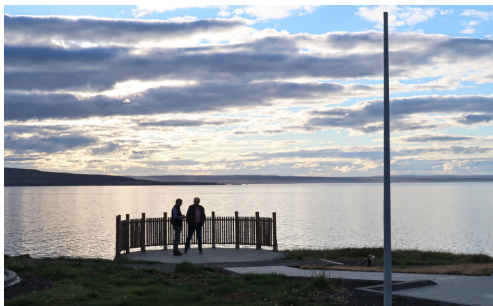
Á Hafnartanganum á Bakkafirði

Um fjöllum um vígslu Hafnartangans má sjá á vef Langanesbyggðar hér .