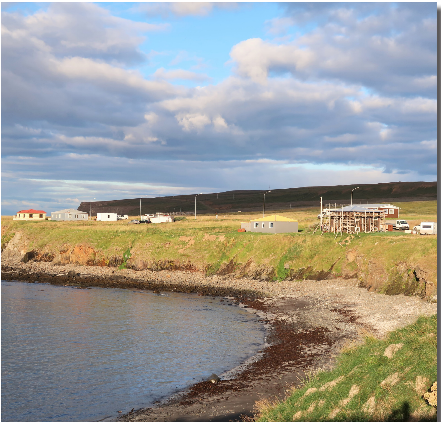
Unnið að endurbótum húsa á Bakkafirði með aðkomu Orkuseturs

jákvætt að meira fjármagn var til úthlutunar úr Frumkvæðissjóði, auk þess fór fram sérstök úthlutun úr Öndvegissjóði Brothættra byggða. Ástæða þessa var sérstakt fjárfestingaráttak stjórnvalda vegna COVID-19. Því hefur ekkert verkefni haft jafn mikla fjármuni og Sterkar Strandir til úthlutunar við upphaf verkefnisins, en á móti kemur að vegna þeirra flóknu aðstæðna sem upp hafa komið sökum heimsfaraldurs fékk verkefnið í upphafi ekki þann slagkraft og samhljóm innan samfélagsins og ætla hefði mátt að það hefði fengið í árferði án samkomutakmarkana. Segja má að verkefnið sé nú að komast af stað með nokkrum þunga. Íbúar eru stöðugt betur að átta sig á þeim tækifærum sem í verkefninu felast og aukinn kraftur er að færast í verkefnið að mati verkefnisstjóra. Fjölmargir hafa farið af stað með frumkvæðisverkefni og hlotið til þess stuðning úr Frumkvæðissjóði Sterkra stranda og gróska er mikil.