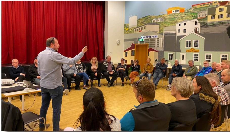
Íbúafundur í Strandabyggð.