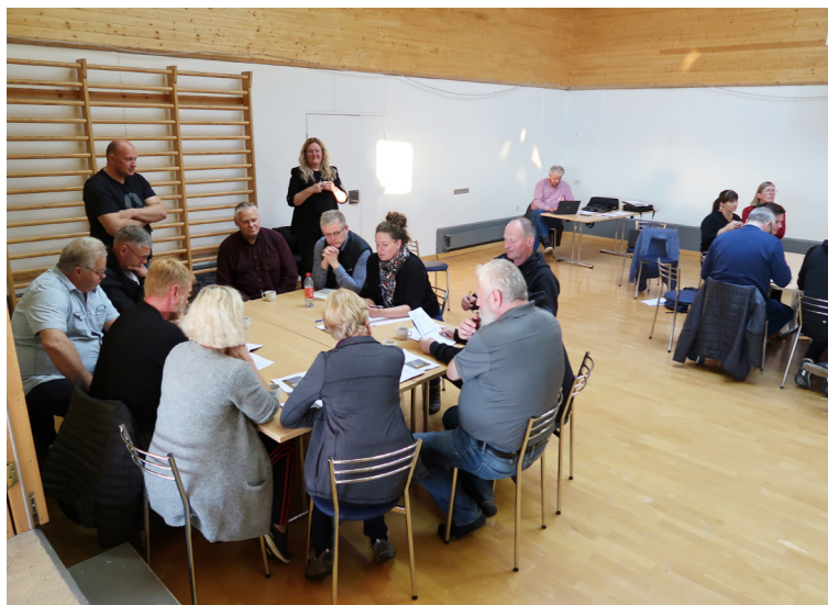
Íbúafundur á Bakkafirði

Verkefnisstjórn hélt sex formlega fundi á árinu. Verkefnisstjóri hefur setið fundi hverfaráðs Bakkafjarðar og verkefnisstjórnar um uppbyggingu á Tanganum. Þá eru haldnir reglulegir fundir starfsmanna SSNE. Dagsetningar verkefnisstjórnarfunda voru sem hér segir: Fjarfundur 9. febrúar, fjarfundur 27. maí, fjarfundur 10. ágúst, fjarfundur 30. ágúst, staðfundur á Bakkafirði 8. september og fjarfundur 17. desember. Íbúafundur var haldinn 8. september.