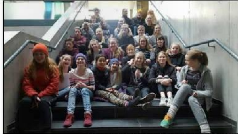
Nemendur 10. bekkjar Heppushöla í starfskynningu hjá Eystrahorni.