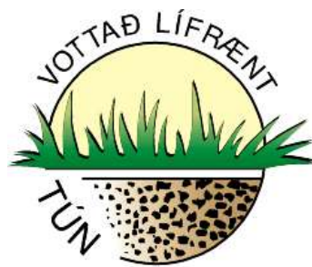
EES-ESB vottun IS-1