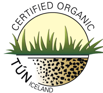
EEA-EU Control System IS-1